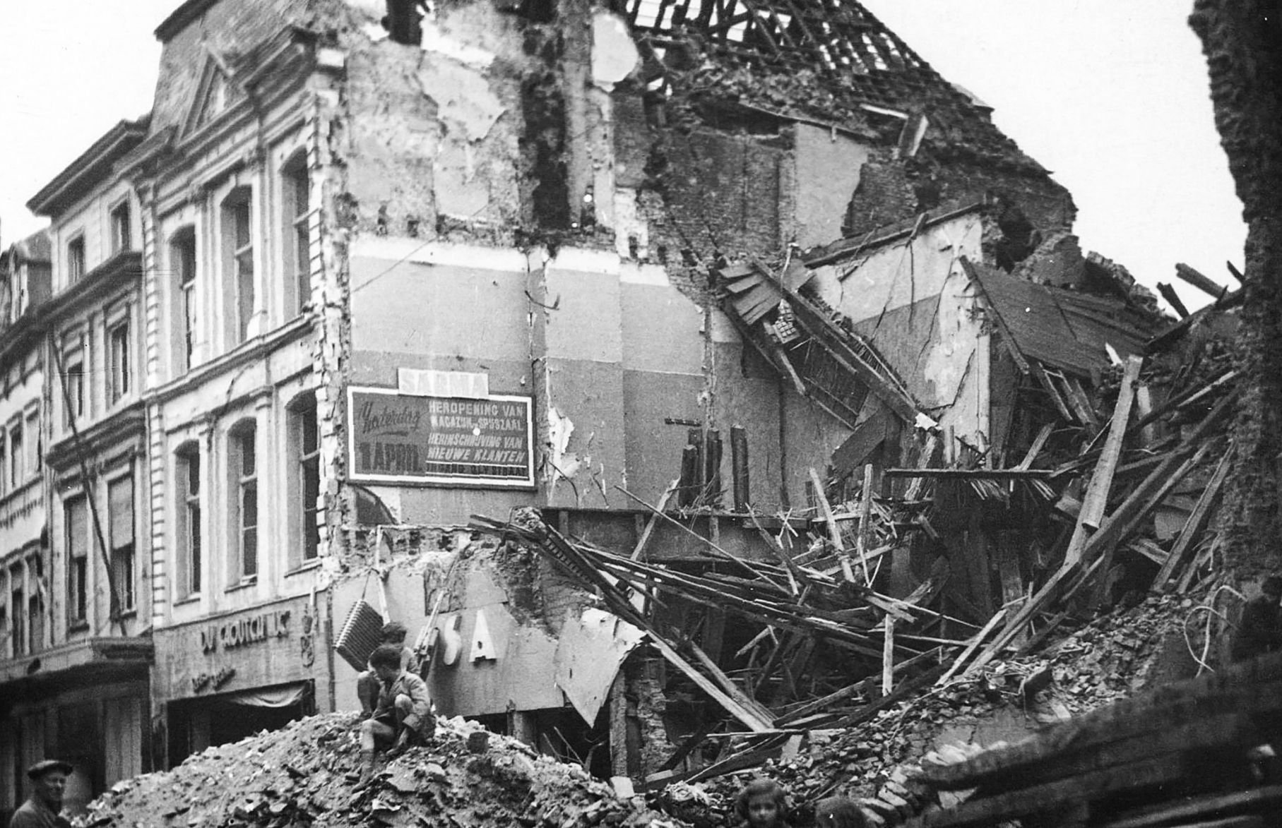
In de Leiestraat 22-24 verwoestte een bominslag de Sarma, het eerste warenhuis van Kortrijk. De letters SA zijn nog te zien op de foto.