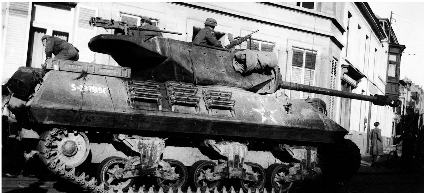
Op 6 september komen de Britse tankeenheden Kortrijk binnenrijden via de Gentsestraat.

Op de 1e verdieping van het historisch Stadhuis hangt als stille getuige een foto van de opmerkelijke en 'toevallige' bevrijding door luitenant Walter Goodman.