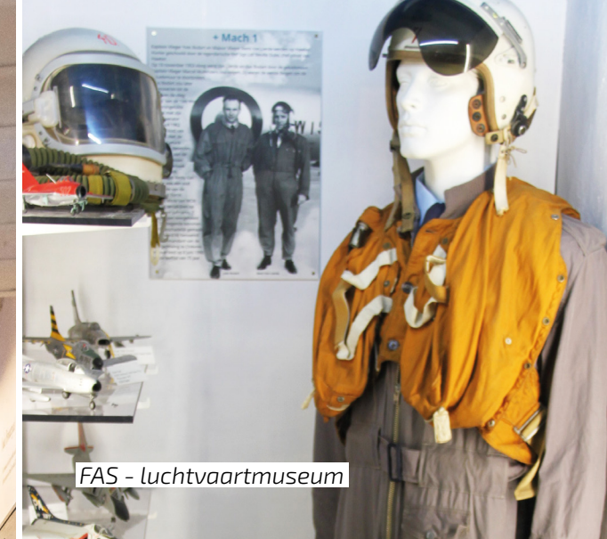
FAS - luchtvaartmuseum