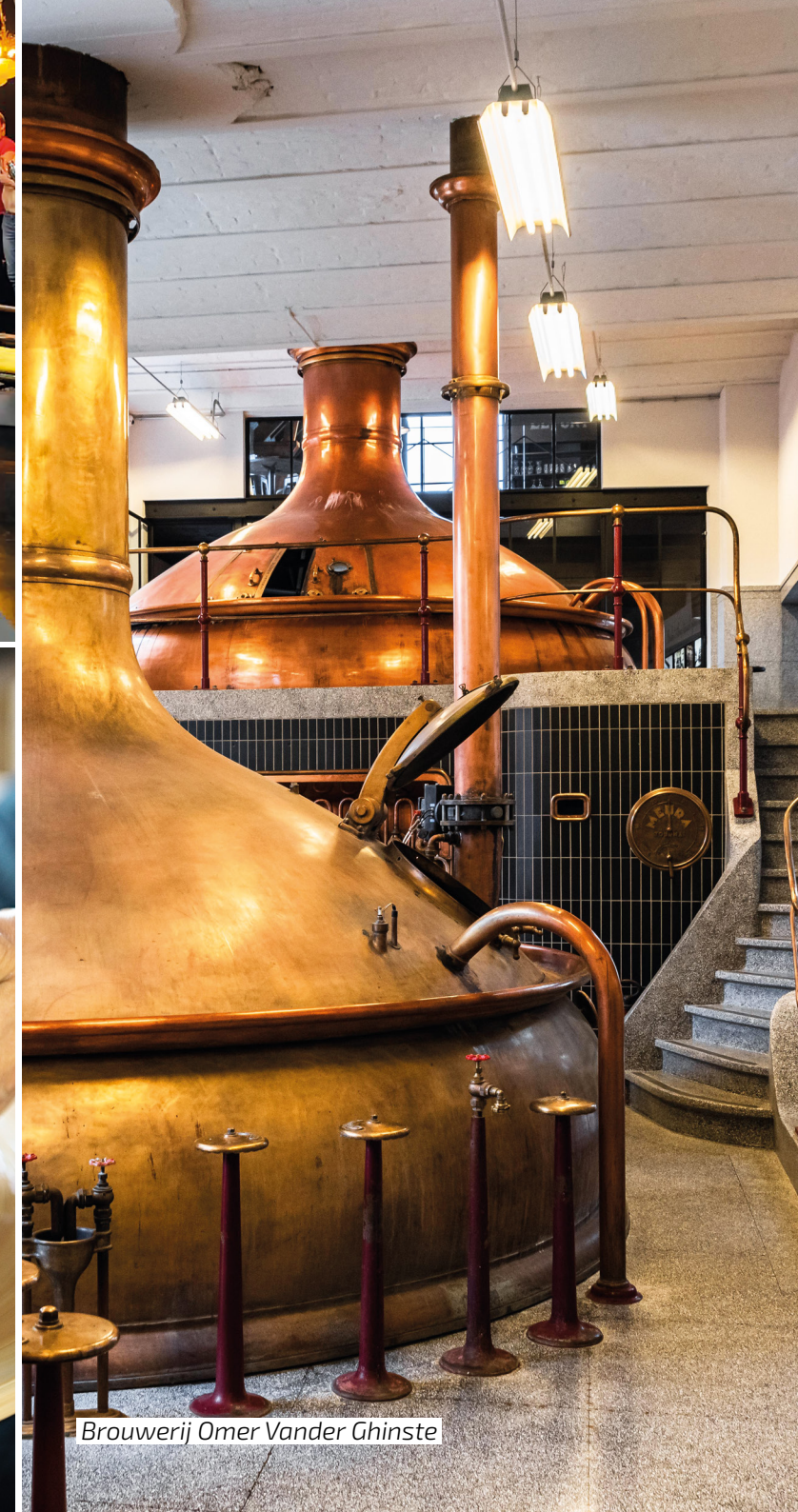
Brouwerij Omer Vander Ghinste