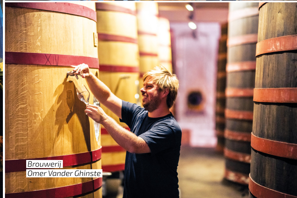
Brouwerij Omer Vander Ghinste