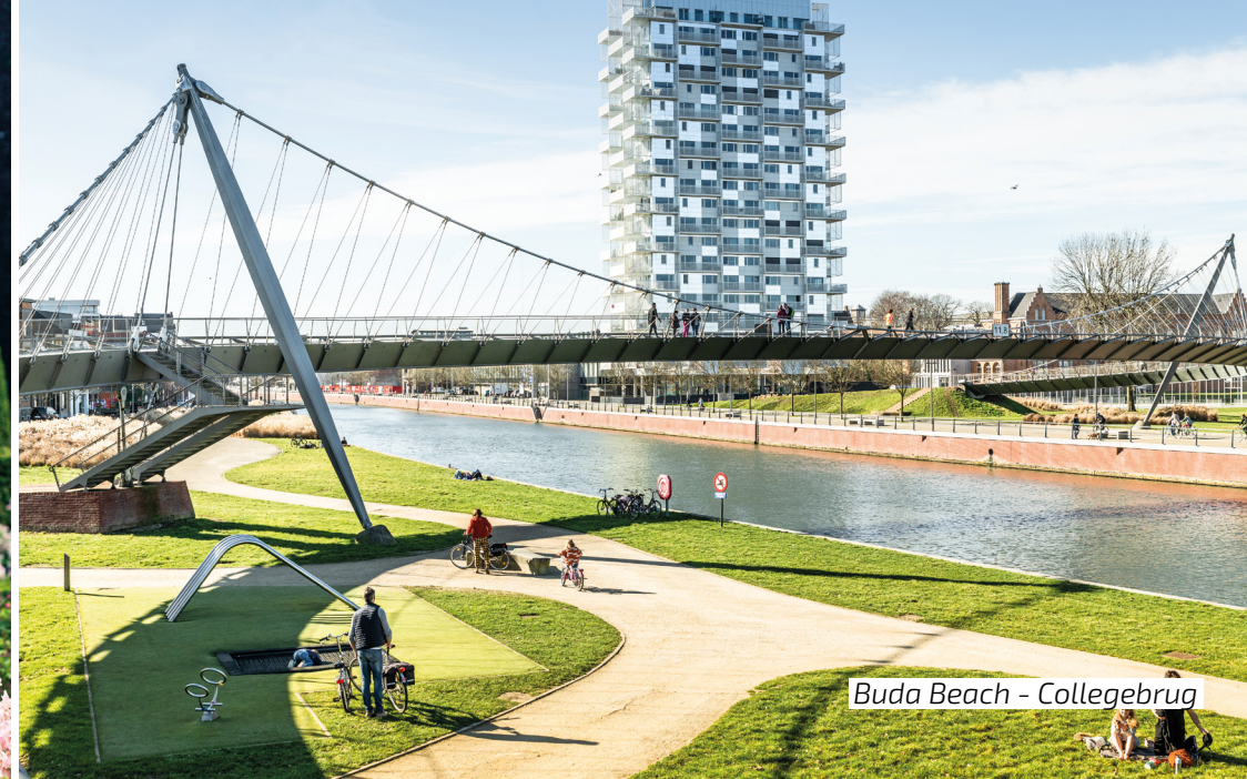
Buda Beach - Collegebrug