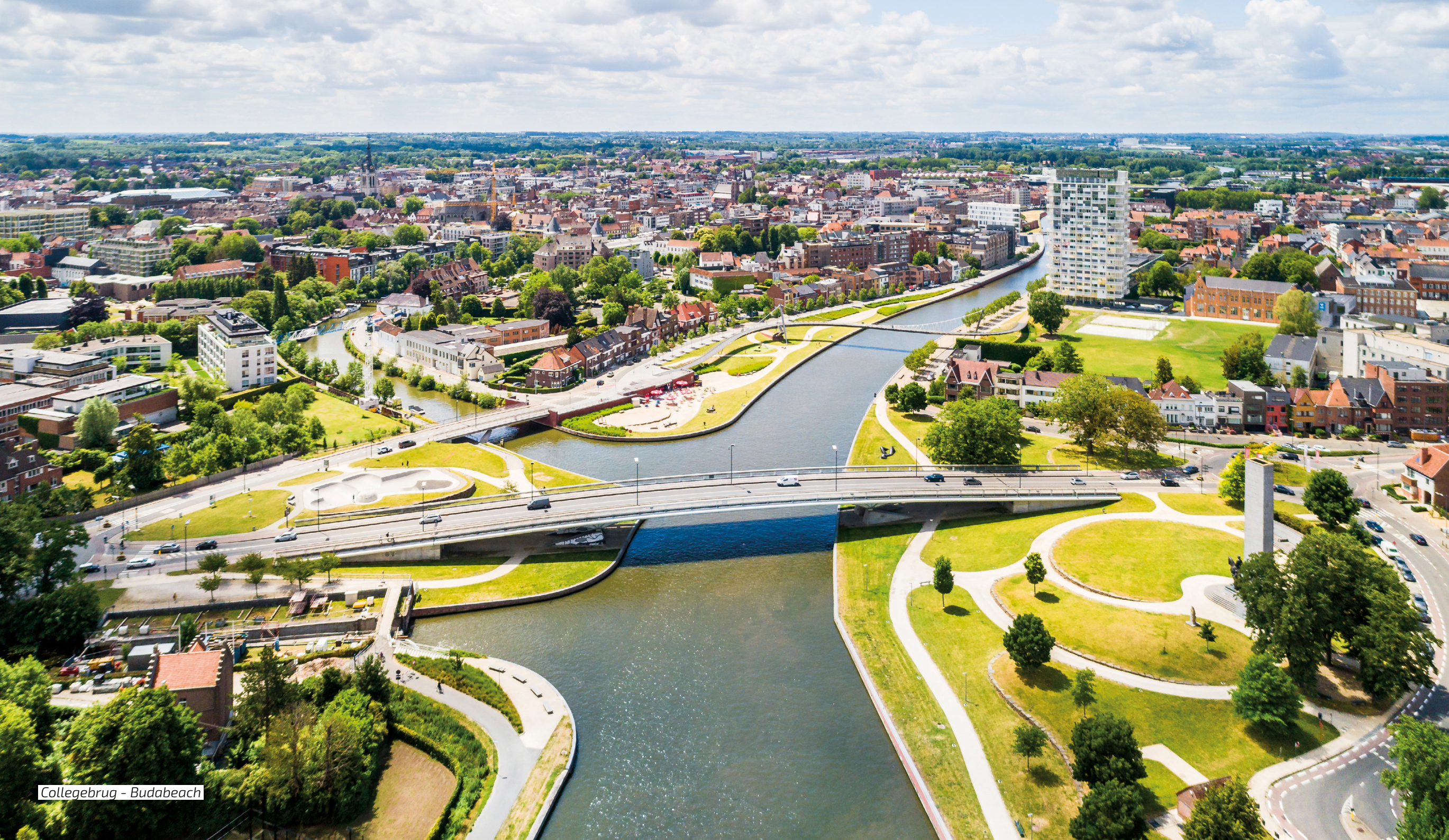
Collegebrug - Budabeach