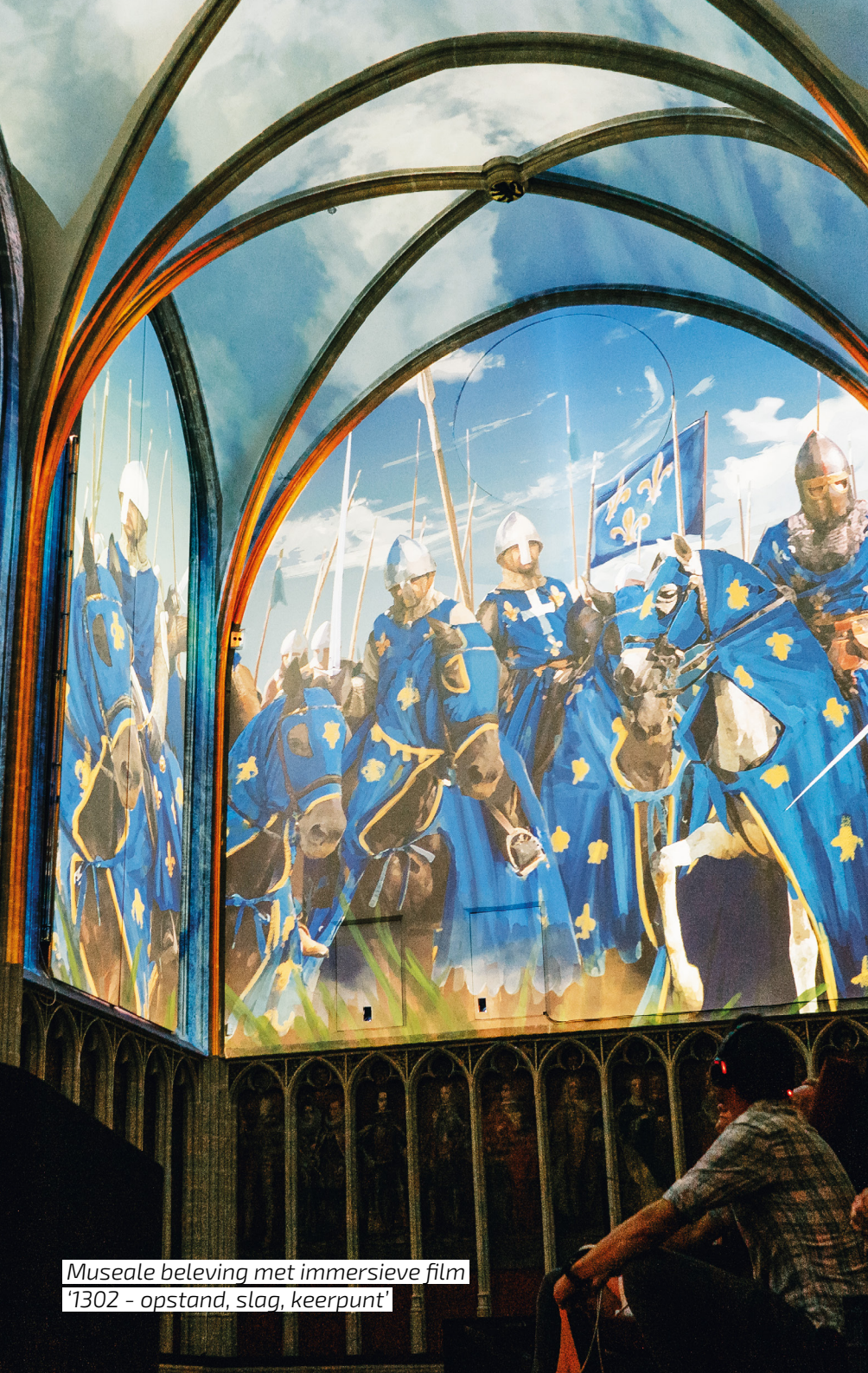
Museale beleving met immersieve film '1302 - opstand, slag, keerpunt'