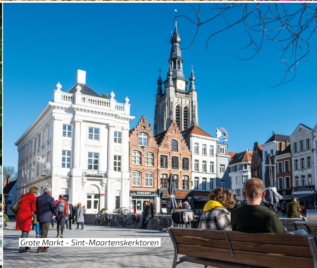
Grote Markt - Sint-Maartenskerktoren